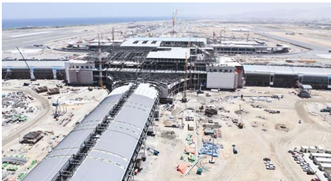
Ny stor flygplats håller på att byggas i Muscat, Oman

Från augusti kan turister ifrån 67 länder ansöka om visa direkt via den nya E-Visa service portalen http://www.evisa.rop.gov.om/ . Oman förväntar en kraftig ökning från 3 miljoner besökare 2016 till mer än 4 miljoner 2020.