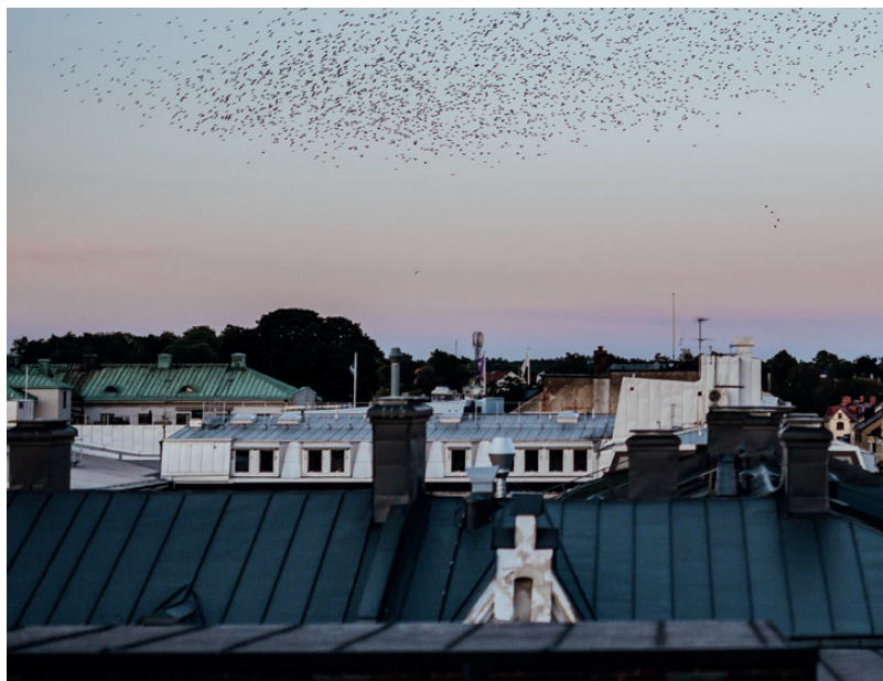
Odd One Out / Foto: Roger Nellis, iStockphoto, Unsplash, Alexander Hall, m. fl.